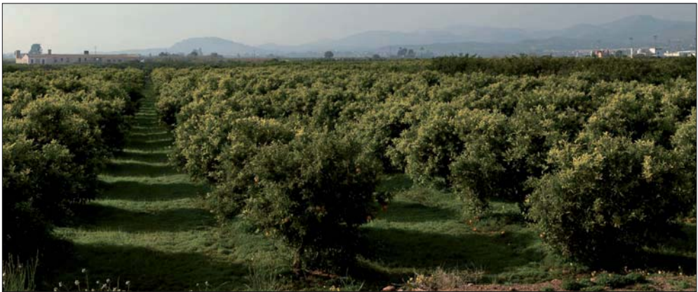
Cultivo cítrico en la Huerta de Massalfassar