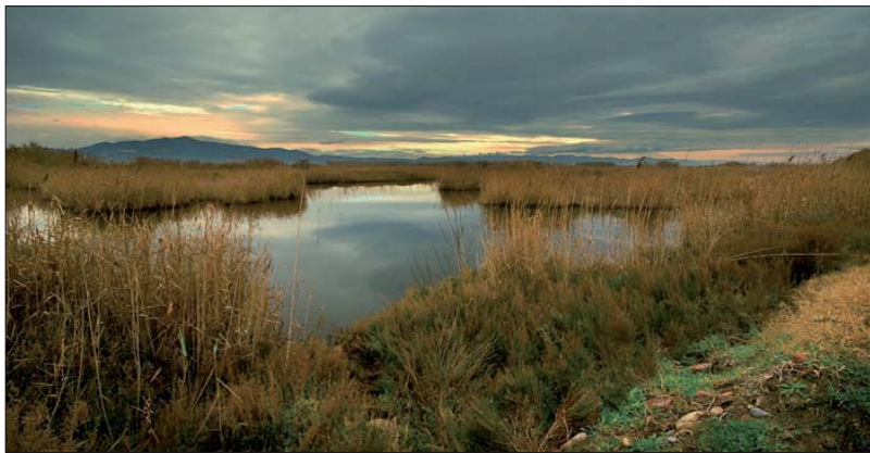
Vegetación palustre en la Marjal dels Moros [Puzol]