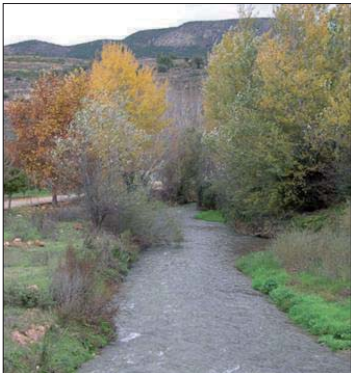
Vegetación de ribera del Turia