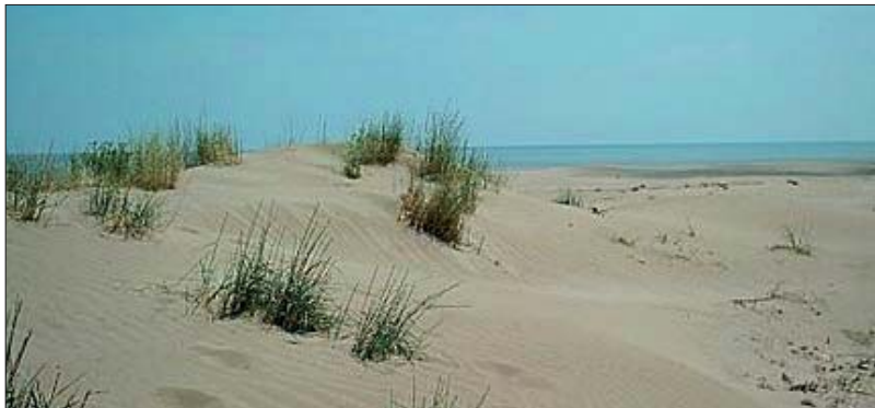
Vegetación dunar, playa de El Saler, Valencia