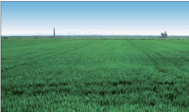
Campos de arroz, marjal de la Albufera