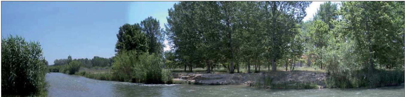
Vegetación de ribera, en el río Turia, Valencia