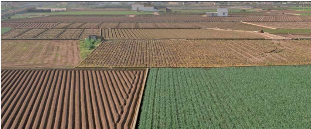
Cultivos hortícolas en la Huerta de Meliana