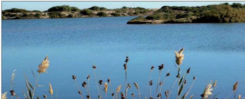
Vegetación palustre y dunar, El Saler, Valencia