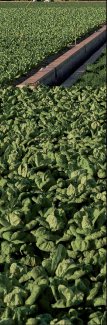
Cultivos de huerta, Alboraya