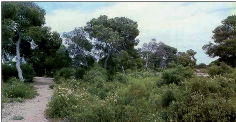
Vegetación de bosque mediterráneo consolidado