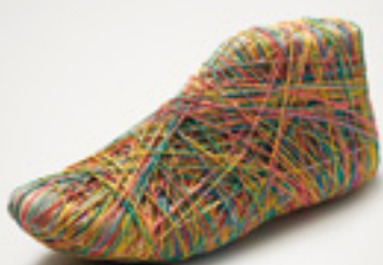
SS 2012 ORIOL PORTA BABILONI GANADOR 1ª EDICIÓN