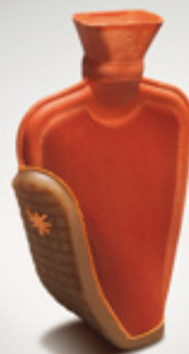
AW 2012 BOSSMAT ELIEZER MENCIÓN 2ª EDICIÓN