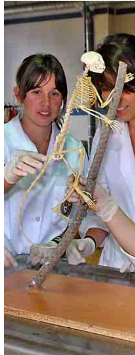
UNIVERSIDAD ALFONSO X EL SABIO

Preside la Red Interuniversitaria de Posgrados en Turismo y colabora con Tourespaña, Segittur y el Consejo Superior de Cámaras.