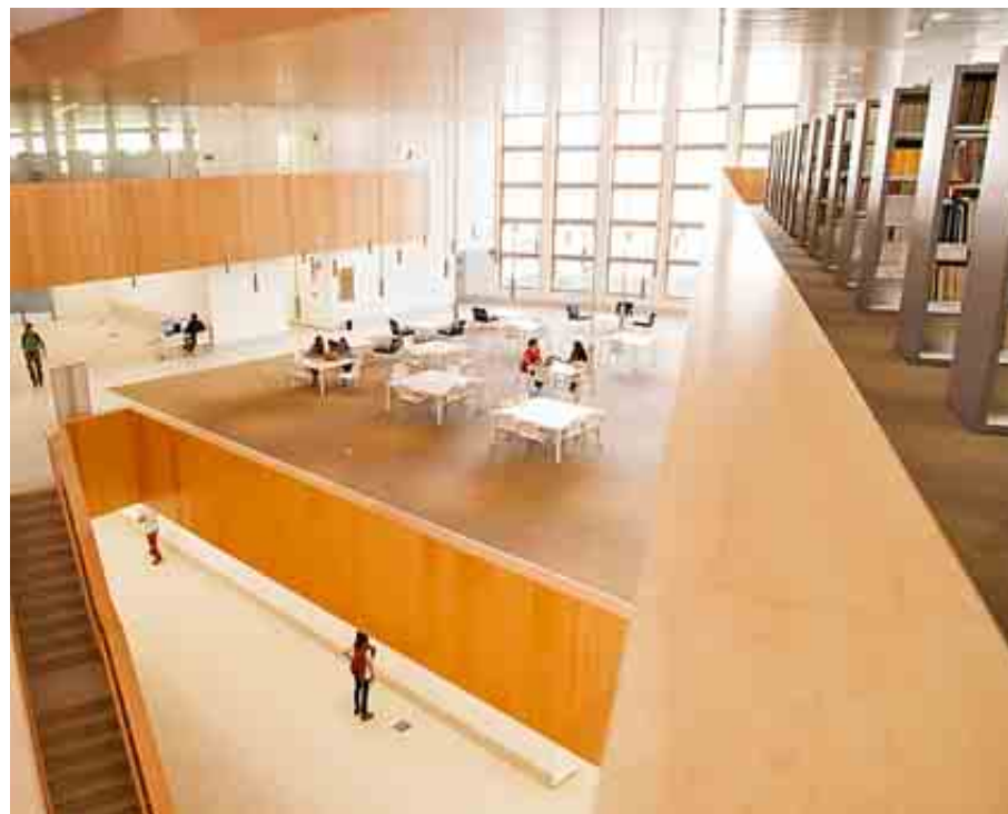
UNIVERSIDAD CARLOS III