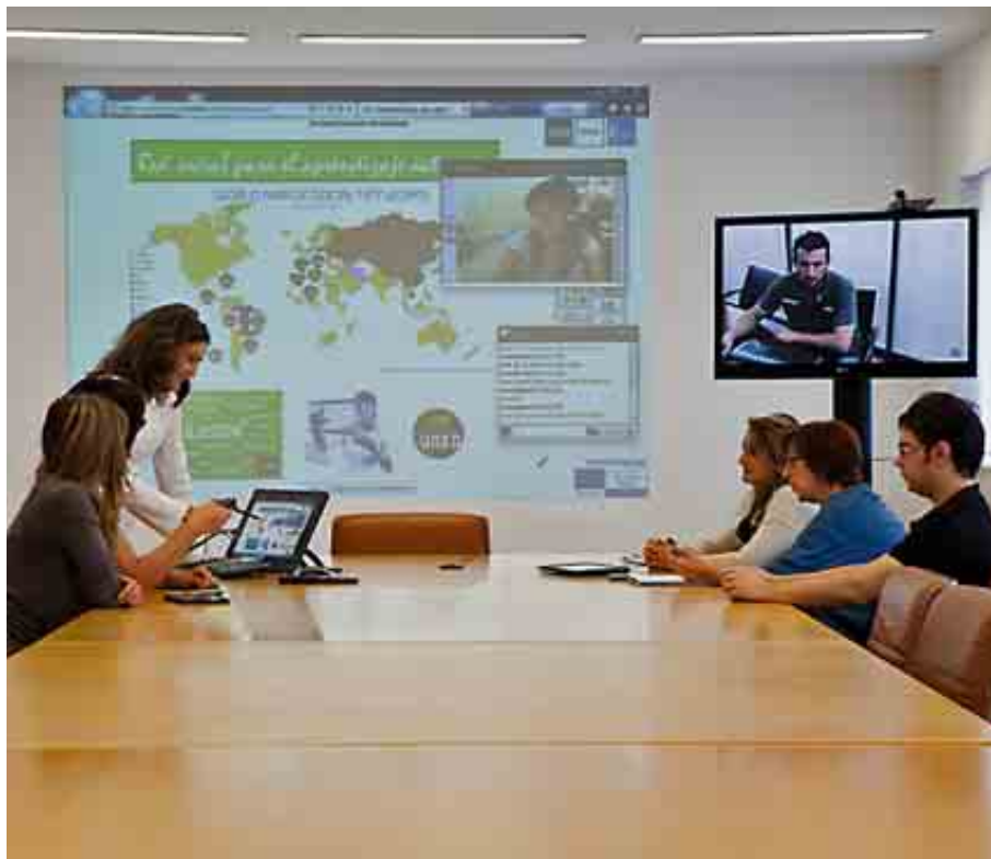
UNIVERSIDAD NACIONAL DE EDUCACIÓN A DISTANCIA

Para el próximo curso 2014-2015, ha incorporado a su catálogo de titulaciones los grados universitarios en Biotecnología e Ingeniería de los Materiales, como «respuesta a las necesidades educativas» de la comunidad y al propio desarrollo de las enseñanzas superiores en la Universidad de Extremadura.