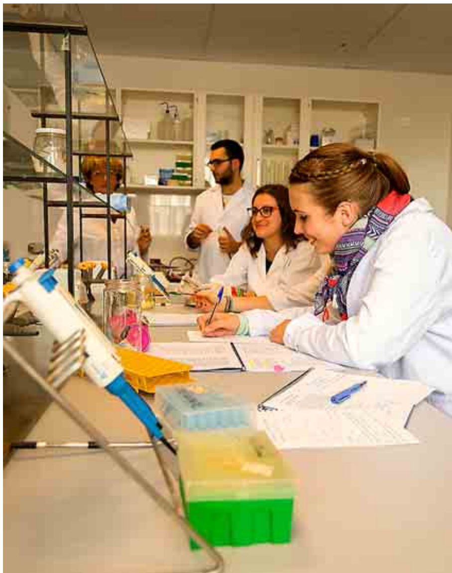
UNIVERSIDAD DE GRANADA

Tiene acuerdos de doble titulación con la Universidad de Varsovia (Polonia), la del Algarve (Portugal) y la del Egeu (Turquía), entre otras.