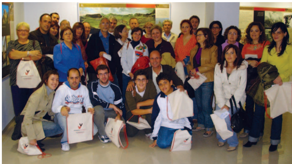
Assignació de parelles del Voluntariat pel Valencià a Torrent (8/11/2007)

Anualment es convoca als participants en el projecte a una trobada col·lectiva on tenen la possibilitat de conèixer més parelles lingüístiques i posar en comú les seues experiències.