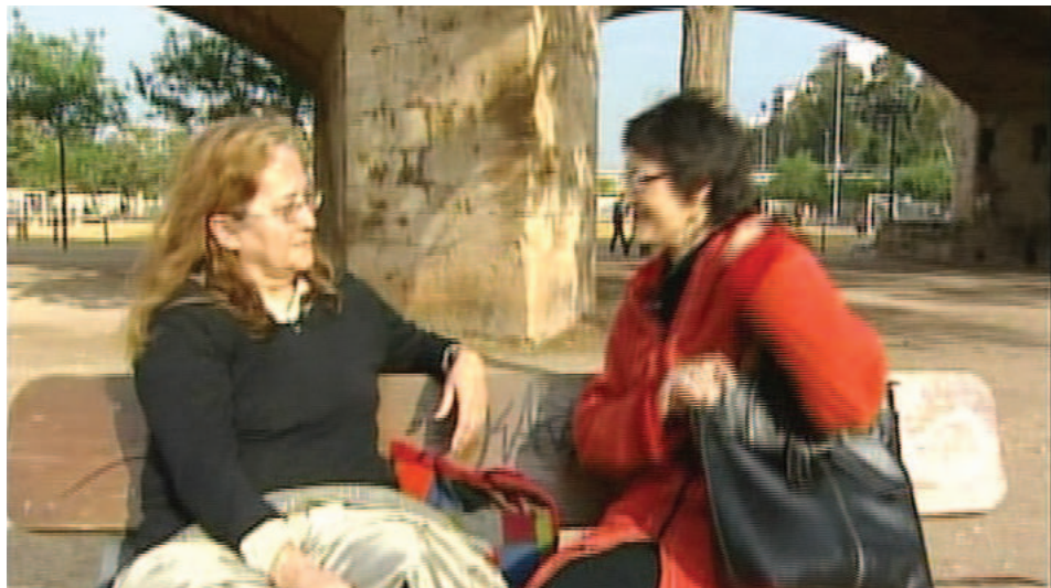
Parelles lingüístiques contenen les seues experiències al programa Solidaris de Punt 2

Es tracta de conversar durant una hora a la setmana en valencià. Una vegada les experiències es multipliquen i els cicles de 10 setmanes acaben, recollim vivències que, a partir del fil conductor del valencià aprofundeixen cap a una convivència basada en el coneixement, la comprensió i el respecte de l'altre. La diversitat es viu com un factor d'enriquiment mutu. Tant per als voluntaris com per als aprenents, el Voluntariat pel Valencià es converteix en una forma de fer amistats i conèixer altres cultures. S'estableixen uns lligams, s'acosten formes de vida distintes i es promou la pertinença a una col·lectivitat, amb el valencià com a factor clau de comunicació i arrelament.