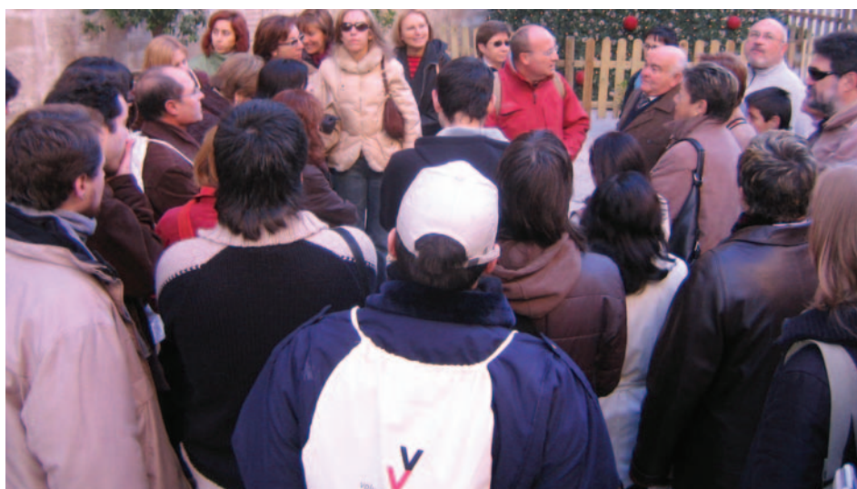
Passejada cultural pel centre de València