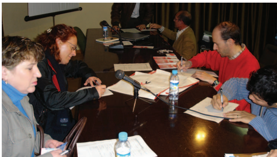
Voluntaris apuntant-se al programa del Voluntariat pel Valencià

Fins ara, la valoració del funcionament del projecte en estes sessions col·lectives ha estat SEMPRE POSITIVA I MOLT ENRIQUIDORA . En elles, a part de la posada en comú, les parelles s'animen a continuar endavant amb el projecte, considerant que no s'acaba l'aprenentatge de la llengua amb les primeres 10 sessions. Per això cal seguir avançant fins aconseguir que, si voluntàriament ho manifesta, un aprenent puga arribar a oferir-se de voluntari.