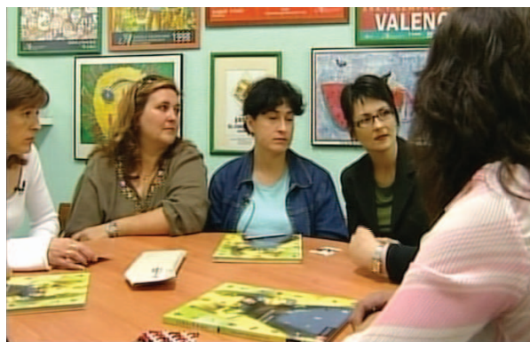
Voluntàries al programa Solidaris de Punt 2

També es realitza mensualment una col·laboració amb el periòdic de distribució gratuïta Xarxa Urbana, amb un vocabulari en diverses llengües.