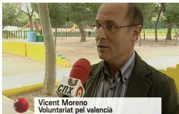
Vicent Moreno a En connexió de Canal 9