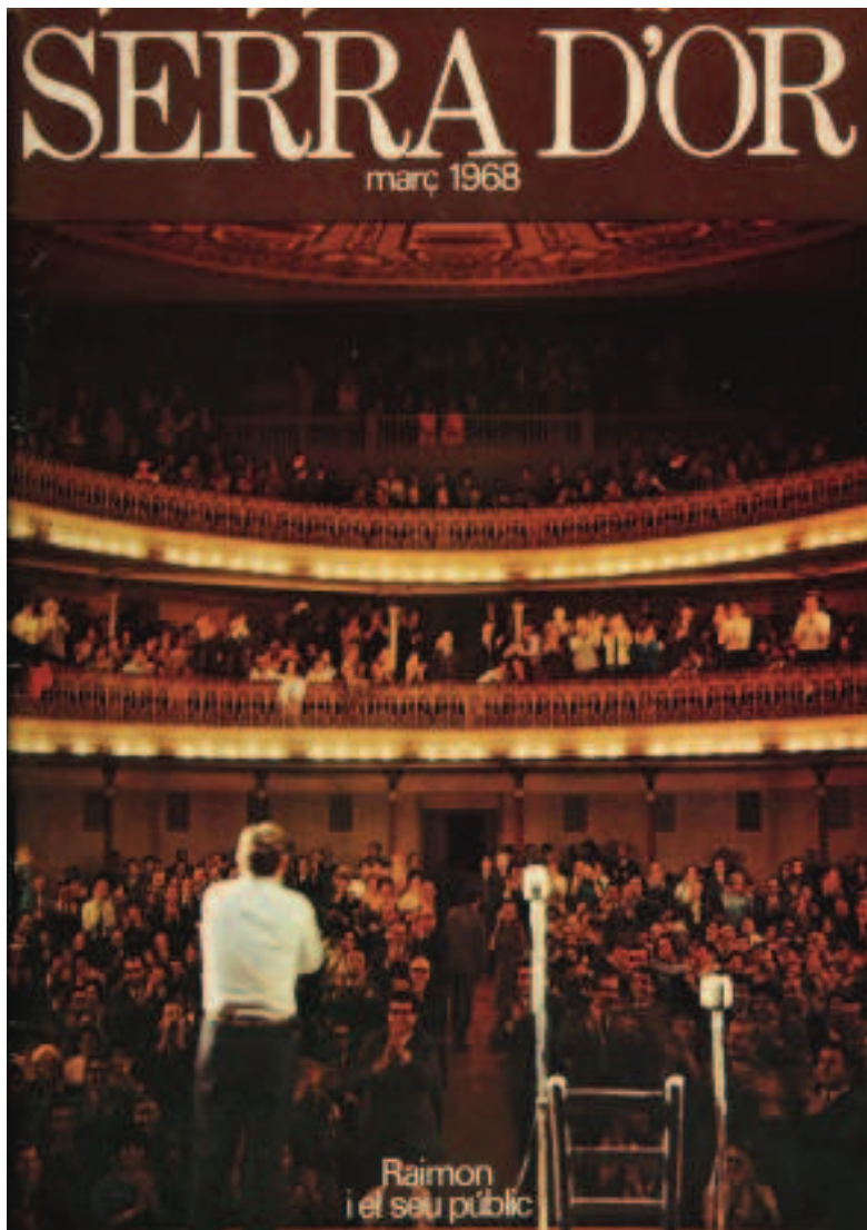
Portada de la revista Serra d'Or , març de 1968