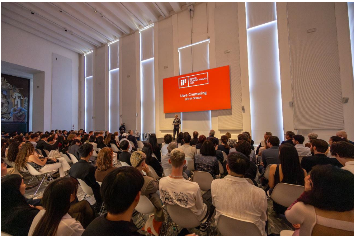
Gala de entrega de los IF Design Student Award en Triennale Milano.