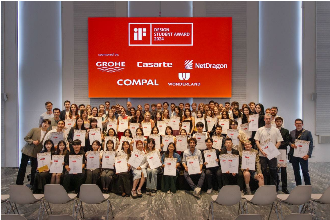
Ganadores del IF Design Student Award 2024