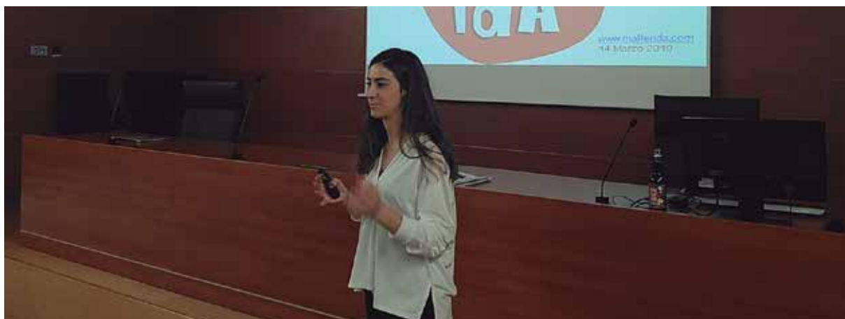
3: La tercera conferencia, “El Caso de Malferida, refresco de cola hecho con ingredientes naturales y